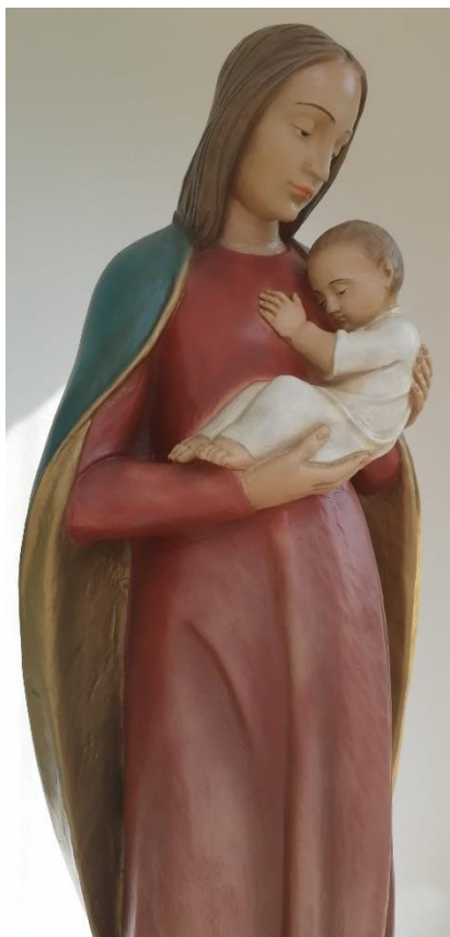
Maria aus einem Marienbildstock bei Mantinghausen

Irmela Mies-Suermann, In: Pfarrbriefservice.de