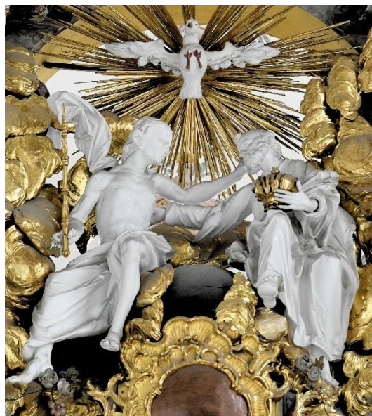
Dreifaltigkeit aus der Predigerkirche in Rottweil

Dorothee Sandherr-Klemp (zu Röm 8,14–17) aus: Magnificat. Das Stundenbuch 05/2024, Verlag Butzon & Bercker, Kevelaer; www.magnificat.de In: Pfarrbriefservice.de