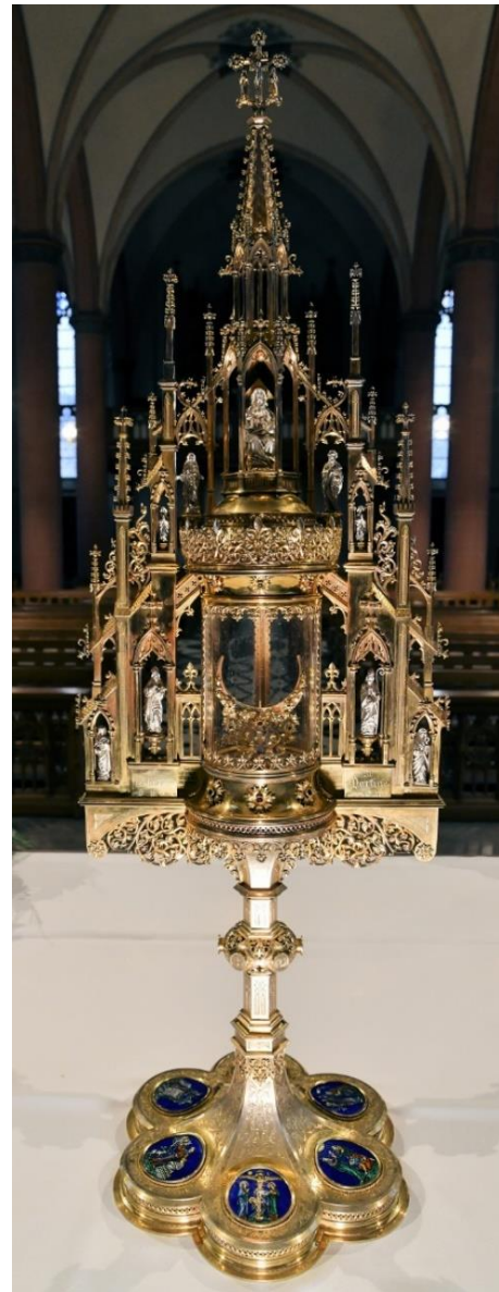
Monstranz St. Martin, Foto Bernhard Bauer