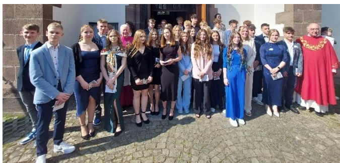
St. Martin Bad Lippspringe

Wir gratulieren auch auf diesem Weg nochmal allen Firmlingen und Firmfamilien und danken für das gemeinsame Feiern. Ein besonderer Dank gilt an dieser Stelle den Katecheten und Katechetinnen, die über ein halbes Jahr ihre Zeit und ihre Ideen in diese jungen Menschen investiert haben. Ebenso ein Danke an die Musikgruppe, die sich aus dem Pastoralen Raum zusammengefunden hat und alle drei (!) Messen musikalisch begleitet hat! Zuletzt geht ein Dank an alle Messdiener, die sich ebenfalls aus dem Raum gemischt haben und die Messen tatkräftig mitgestaltet haben. Ihr alle seid ein Segen mit eurem Dasein und Tun!