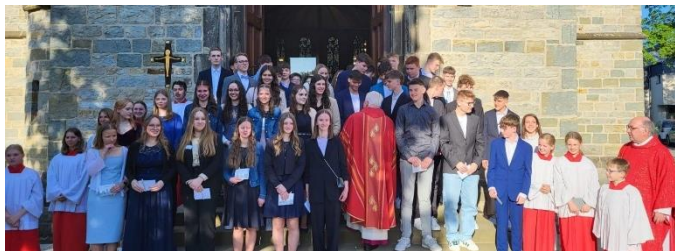
Heilig Kreuz Altenbeken