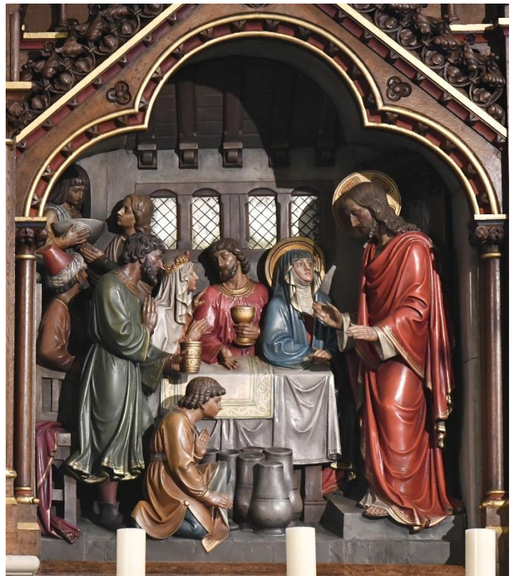
St. Marien Neuenbeken

„So tat Jesus sein erstes Zeichen – in Kana in Galiläa.“