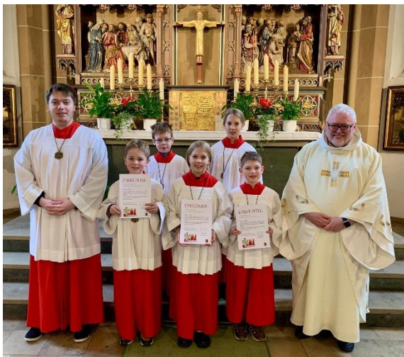
Heilig Kreuz Altenbeken