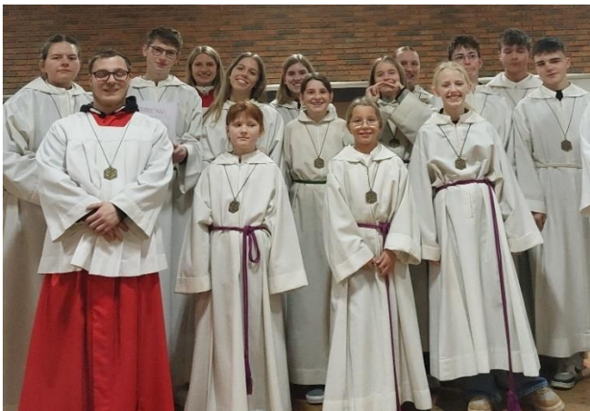
St. Dionysius Buke

Freuen wir uns über diesen Nachwuchs und danken an dieser Stelle allen, die immer wieder neue Messdiener ausbilden und ihre Zeit in das Wachstum dieser Gemeinschaft stecken! - Schön, dass es euch alle gibt!